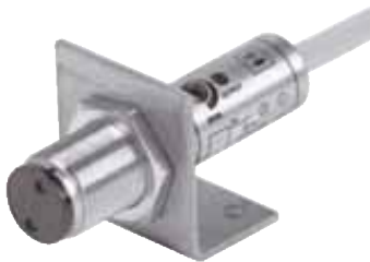
Sensor montado en el soporte de montaje

Con ayuda del soporte de montaje los sensores cíclicos se pueden montar de forma rápida y sencilla. Para la fijación, utilice las tuercas incluidas en el paquete de suministro del sensor.